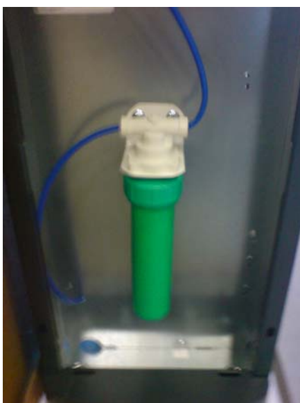
Filterhus med innehållande filterpatron, skall bytas var 6:e månad.