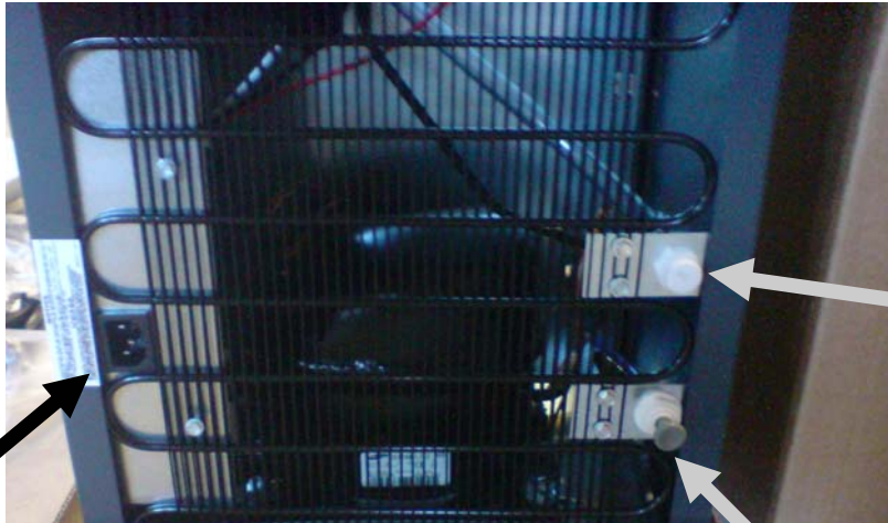
Anslutning el, 230 V.