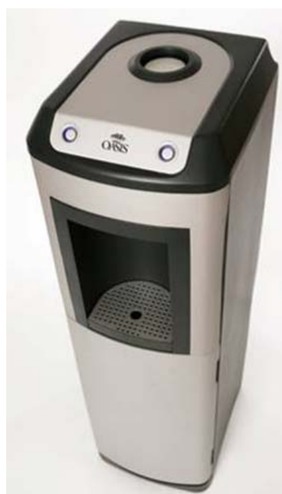
Knapp till vänster: Rumstemperatur