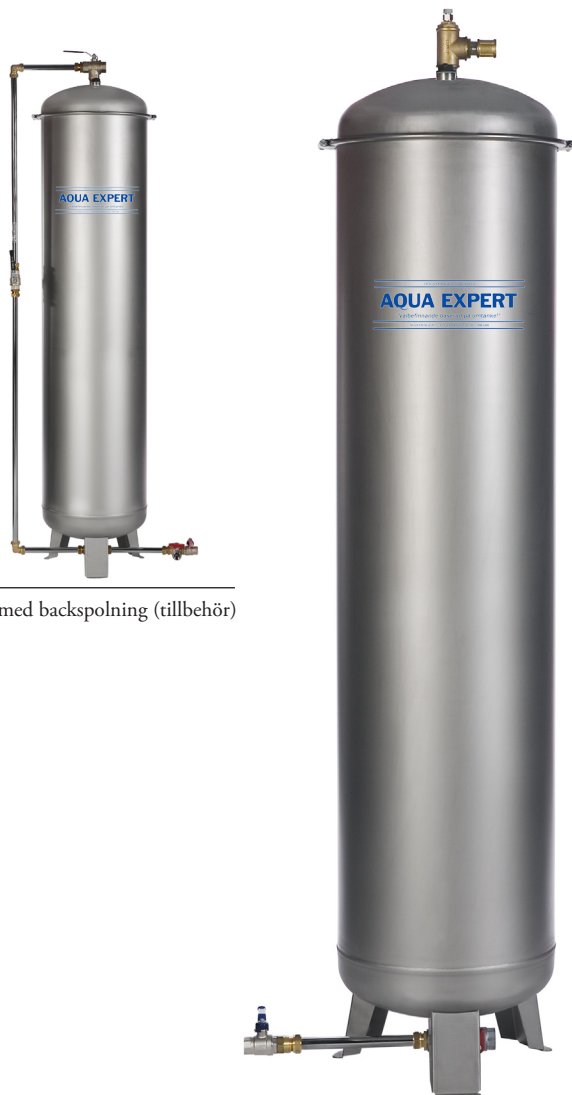
Kol med backspolning (tillbehör)