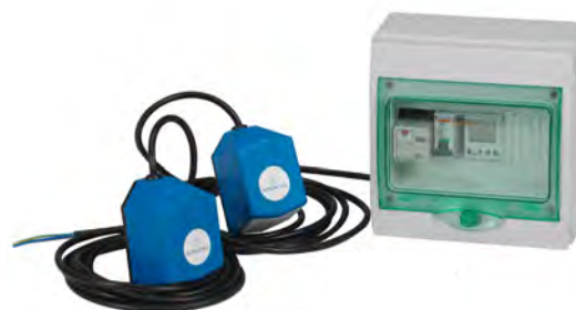
Automatiksats till Kombi (tillbehör)

Nu med stor påfyllningspropp för att underlätta vid service och underhåll!