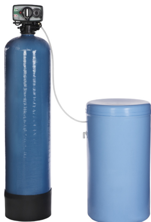
M40, M60, M80, M100